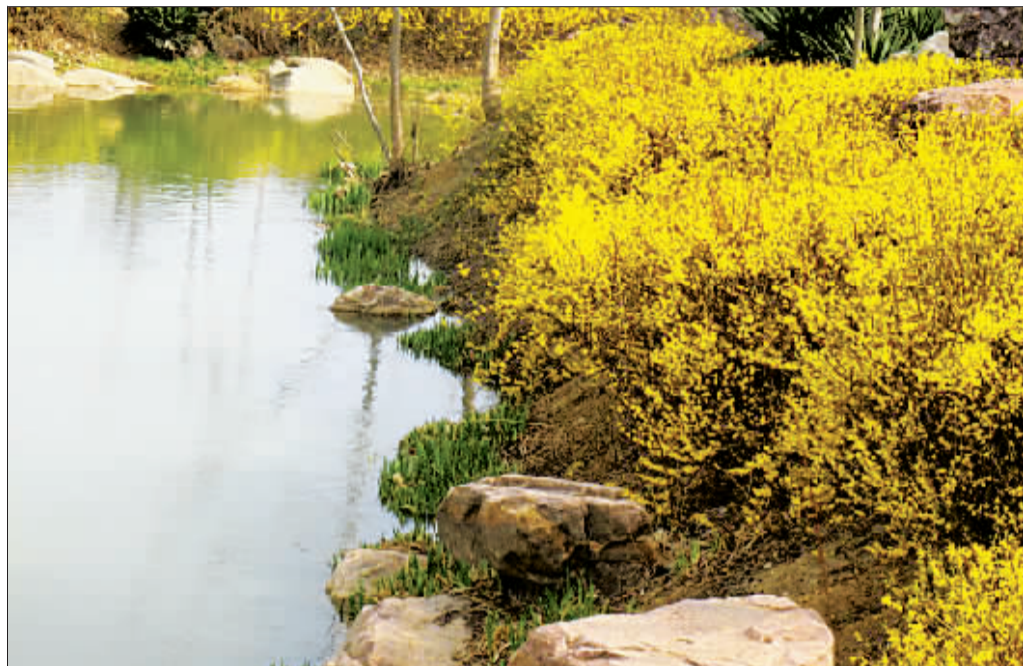
隋唐城遗址植物园内, 连翘花开得正盛。