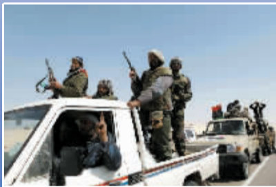
反政府武装人员庆祝重新夺取艾季达比耶。