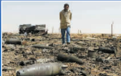
26 日，在艾季达比耶，一名男子走过散落弹壳的地面。