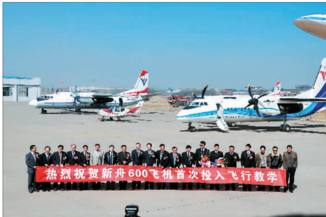
庆祝新舟 600 飞机首次投入教学飞行。

□见习记者 马菁华 记者 冯莹雅 通讯员 杨德贵 刘军/文 记者 张 晓理 潘郁 李卫超/图