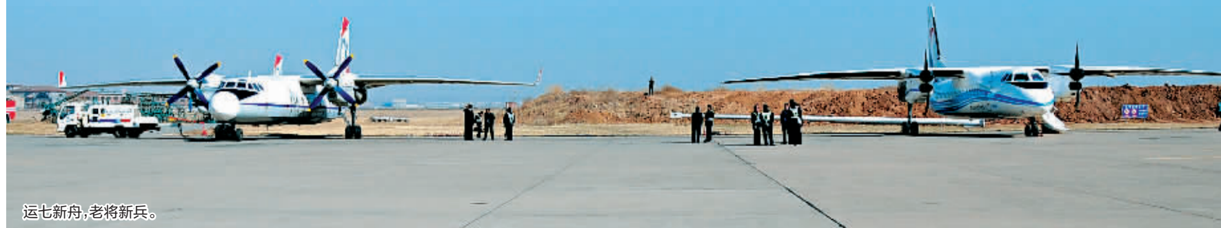
运七新舟,老将新兵。