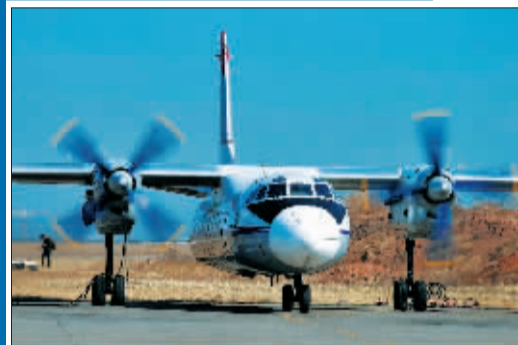
运七-100 飞机在洛阳最后一次教学飞行。