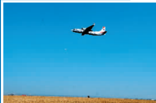
运七-100 飞机空中翱翔。