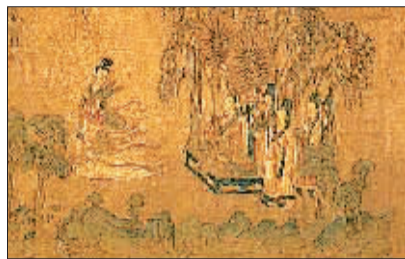
东晋顾恺之《洛神赋图》(局部)(资料图片)