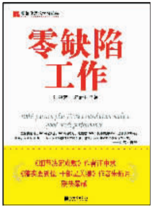
○汪中求 朱新月 著

之前何小兵内心还充满恐惧。这回终于落地了，发现自己并没有摔死，除了高兴，还能怎么样呢？何小兵从床上一跃而起，觉得新生活从这一刻就要开始了。 这一年来，何小兵的生活已经比前一年有了很大变化。首先是疏远了夏雨果。在正式分手前，何小兵减少了和夏雨果见面的次数。 夏雨果找何小兵的时候，叫他他也不回。后来夏雨果发现何小兵和她见面的时候也心不在焉，就问怎么了，头两次何小兵怕伤害夏雨果，没摊牌，只说自己心情不好。又过了些日子，何小兵发现自己整天除了耗着、回避这事儿，就没干什么有意义的事儿，他觉得这事儿必须得断了，于是向夏雨果挑明。 何小兵说得比较婉转，以夏雨果明年就要高考为由，建议两人先分开一段时间。夏雨果说，如果何小兵怕影响她学习，那大可不必，她这两年的成绩就是最好的证明。她知道，何小兵必有其他原因，问他到底为什么，何小兵说没有为什么，他就想一个人呆着。 夏雨果理解不了，为什么两个人待得挺好的，何小兵突然想一个人呆着了？何小兵说他自己也解释不太清楚，总之，他现在就想一个人呆。夏雨果默默地盯着何小兵看了会儿，转身离开了，何小兵没有看到夏雨果离去时的表情。他想告诉夏雨果，碰到什么事儿，可以找他，但没有开口，他怕那样一来，跟两人还在一起没什么区别。 刚分手后的那几天，何小兵并没感觉到两人真分开了，直到很长时间没再见过夏雨果，手机上也不再有什么留言时，他才意识到两人真的分开了。这时，何小兵又恢复了触景生情、睹物思人的功能，带着对夏雨果的想念和自责，开始写歌了。 这半年，何小兵写出不少东西，自己录了一盘磁带小样，往各大唱片公司送。有的人听完，问问小兵想要干什么，何小兵说要自己出张专辑。唱片公司的人说那没戏，卖给别人唱可以。何小兵说别人唱不出感觉来，歌都是他发自内心写的，只有他明白该是什么感觉。唱片公司的人劝何小兵，别自我感觉太好了。 在出专辑这事儿上，何小兵处处碰壁，没人肯出，原因很简单，与其花钱捧一个不知道能否收回投资的新人，况且这个新人唱得并没有多好，不如多给老人录几张专辑，没风险。 何小兵不服，他把一切拒绝他的人都当成傻帽儿，发誓要把自己的这张专辑做出来、畅销，让那群傻帽儿后悔。所以，他并不气馁，仍不慌不忙地写着歌、玩着乐队，等着那一天的到来。