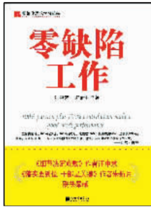
○汪中求 朱新月 著

瑞士著名教育家裴斯泰洛齐说：“今天应做的事没有做，明天再早也是耽误了。”也许对于个人来说，一天的时间算不了什么，但是对于一个团队，对于一家企业，对于国家来讲，耽误的就不仅仅是时间了。