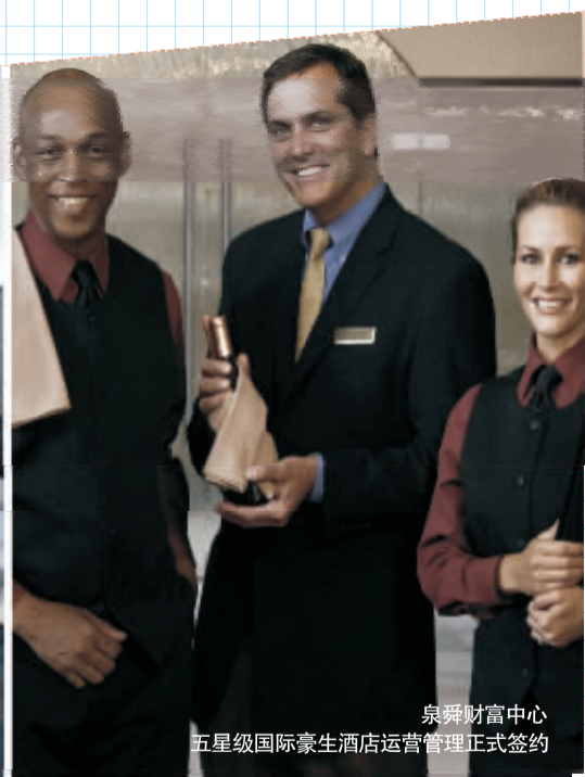
泉舜财富中心 五星级国际豪生酒店运营管理正式签约