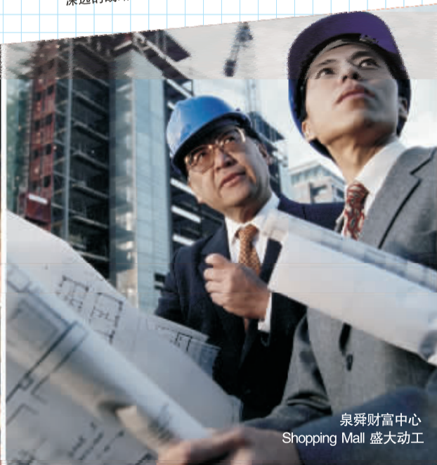
泉舜财富中心 Shopping Mall 盛大动工