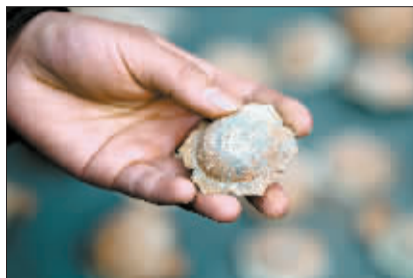
出土的铜质鎏金泡钉。