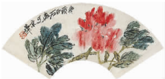
齐白石 纸本牡丹扇面