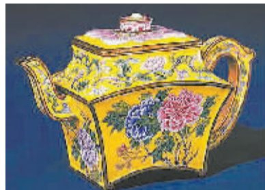
铜胎画珐琅彩牡丹纹扇式方壶