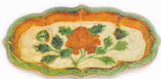
牡丹纹三彩海棠式长盘

牡丹纹饰是一种典型的艺术品装饰纹样。在不同时期、不同材质的艺术品上，牡丹有着不同的表现形式和构图方式，主要有独枝、交枝、折枝、串枝、缠枝以及适合式、对称式、均衡式等。唐代金银器、宋、辽、金时期的瓷器上都有牡丹纹。唐代镏金银器上的缠花牡丹饱满圆润；磁州窑器物上则为白地黑花牡丹；定窑瓷器上常出现一枝独秀的单朵牡丹；耀州窑瓷器上多见牡丹两两相对，青釉碗内壁刻画的牡丹花朵盛开，枝繁叶茂，布满瓷器。元、明、清三代，牡丹纹久盛不衰，多被用作器物主纹，有瓷器、漆器、珐琅器、料器等，主要装饰在镜、瓶、碗、盘、罐的主要部位。明代器物上的牡丹纹丰富多彩，表现手法各异：宣德青花牡丹纹，图案精致，装饰效果强烈；嘉靖酱釉描金牡丹纹在器物腹部开光中贴金描画孔雀牡丹，尤显富贵华丽；永乐剔红牡丹纹漆器色彩纯正，布局饱满，雕刻筋脉舒卷有力，刀法浑厚婉转，充分表现出牡丹丰富的层次。清代珐琅器、粉彩瓷器上的牡丹纹多以工笔重彩描绘，釉色华丽，纤毫毕现，将牡丹的国色天香、雍容华贵表现得淋漓尽致。