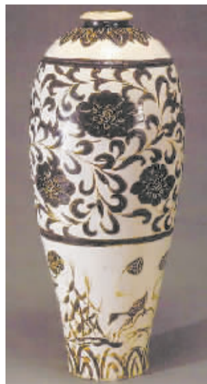
磁州窑白釉黑花牡丹纹梅瓶