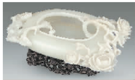
白玉雕折枝牡丹三足洗