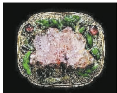
银镏金嵌翡翠碧玺牡丹纹带扣