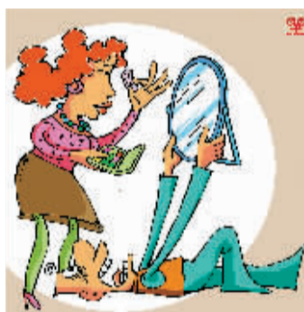
▲一个男人莫名其妙地给予你关心帮助,你要留神了。