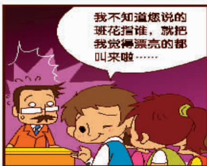
▲搬花和班花 陈玉宇 (newscartoon 供稿)