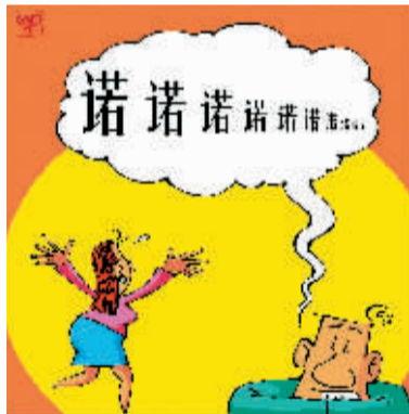
▲不要向心爱的人随意许下诺言,有些承诺或许你永远也做不到,不要让她在期望中失望。