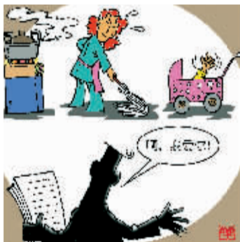
▲说一万句我爱你,不如实实在在地做一件爱她的事情。