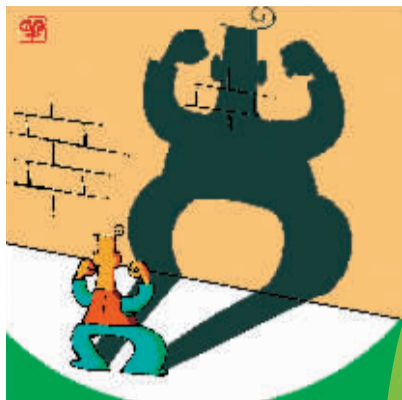
▲男人最喜欢用坚强和笑容来包装自己。