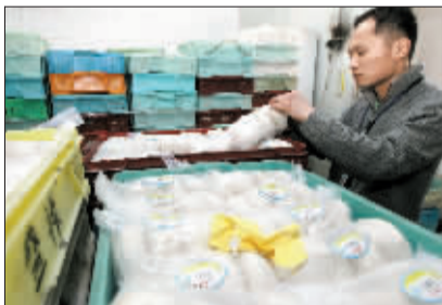
盛禄公司仓库中被封存的面粉。