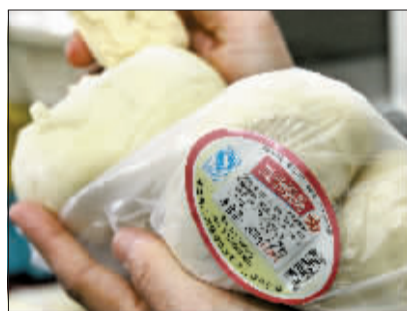
11日生产的馒头标注的却是4月12日。