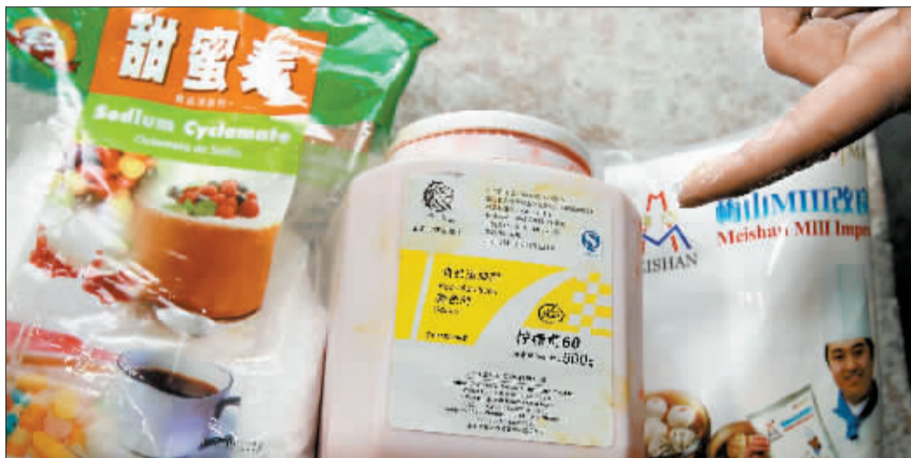
盛禄公司随意使用制作馒头的各种添加剂。

“用色素化妆的馒头,居然能够堂而皇之地摆上大超市的货架,‘回炉’板鸭、‘染色’馒头,还有多少问题食品隐藏在我们身边”……上海多家超市销售违法使用色素的馒头被媒体曝光后,迅速引起公众的质疑。食品安全领域为何频频拉响警报,企业的道德底线和政府的监管力度都成为拷问的对象。