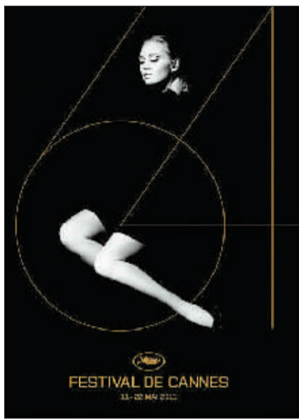
第64届戛纳电影节海报