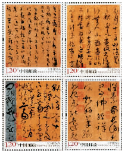
“草书”邮票一组共4枚。