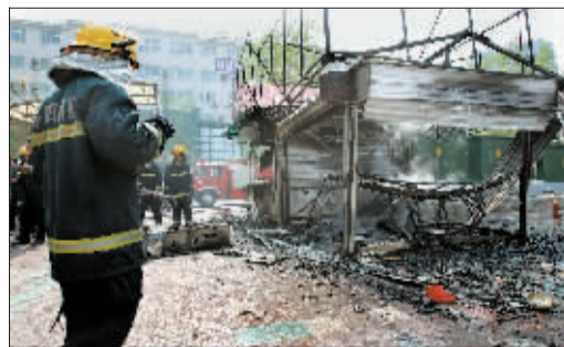
移动房被烧成空壳。