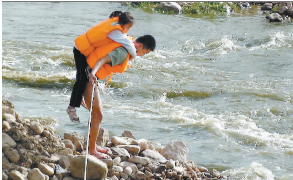
消防队员将被困儿童背到岸边。