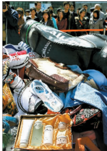
等待集中处理的一批假冒名牌。