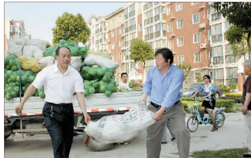
古城乡政府工作人员给辖区居民送去“爱心菜”。

据了解,古城乡政府将首批收购的“爱心菜”送至辖区所在的龙祥、龙和安置小区部分居民家中,龙腾、龙丰等安置小区的建设指挥部以及省针灸推拿学校、河南科技大学和洛阳理工学院也收到部分“爱心菜”。