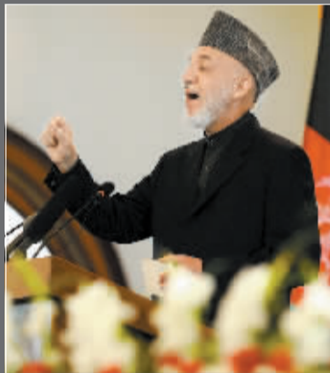
阿富汗总统卡尔扎伊在喀布尔发表讲话，对“基地”组织领导人本·拉丹之死表示欢迎，并呼吁阿富汗塔利班放下武器，与“基地”组织决裂。