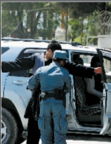
5月2日，位于阿富汗首都喀布尔的美国驻阿富汗大使馆安保人员加强戒备，盘查过往车辆。