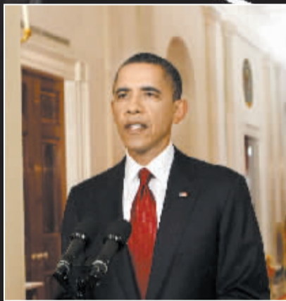
5月1日，美国总统奥巴马在白宫宣布本·拉丹死亡后对记者发表讲话。

23点15分，奥巴马在白宫东厅发表电视讲话，向全世界宣布了他就任以来“在国家安全上最大的胜利”。