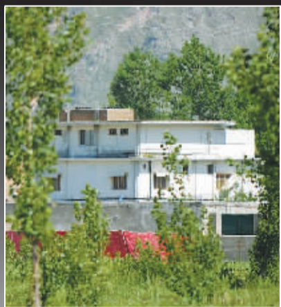
拉丹就是在这座建筑内被击毙的。