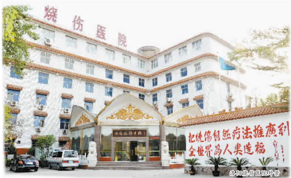
洛阳烧伤医院外景

另外，该院还拥有我国唯一的烧伤医药工程技术研究中心、烧伤医药研究所和总计1800余亩的烧伤专用植物药博园，形成了种植、制药、救治“三位一体”的完整烧伤急救治疗体系。