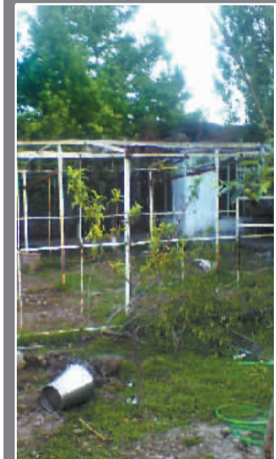
拉丹住所院内情形。