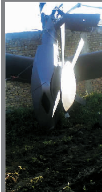
美军坠毁直升机的螺旋桨残骸。