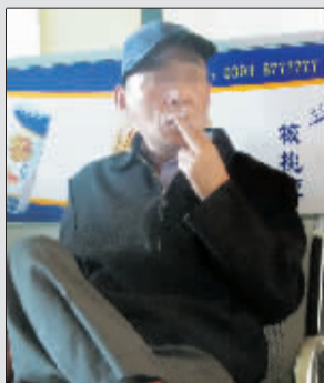
乘客在火车站候车厅吸烟。