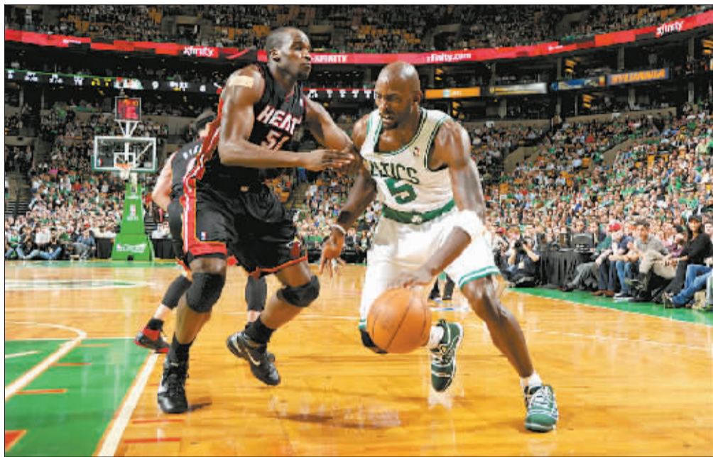
凯尔特人队球员加内特(右)带球突破。

9日的两场NBA季后赛均战至加时赛,新“三巨头”发威的迈阿密热火队在客场通过1个加时赛以98:90战胜波士顿凯尔特人队,以总比分3:1获得赛点;而俄克拉荷马雷霆队则在客场经过3个加时赛以133:123击败孟菲斯灰熊队,将总比分扳为2:2平。