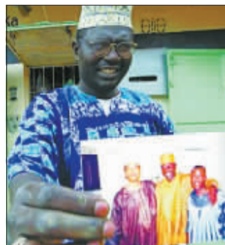
马利克手持与奥巴马的合影。

国总统之际,马利克以其父亲老奥巴马的名义,在美国成立了一家慈善基金会,声称所募集的善款将用于改善肯尼亚穷人的贫困生活。