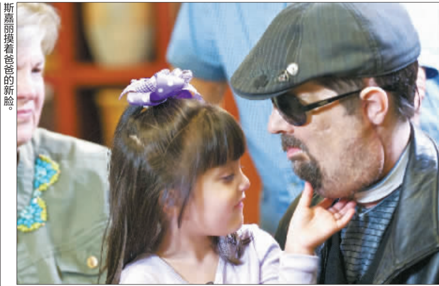
斯嘉丽摸着爸爸的新脸。