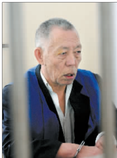
□记者 马毓莹 通讯员 陆明放 杨伟峰/文 记者 赵朝军/图