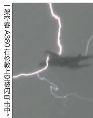
一架空客A380在伦敦上空被闪电击中。

中国日报供本报特稿 据英国《每日邮报》网站5月12日报道,上个月,一名摄影师抓拍到一道闪电穿过正在伦敦上空飞行的空客A380时的场景。而这架飞机在几分钟后竟然完好无损地降落在伦敦希斯罗机场,并且机上的500名乘客及机组人员无一受伤。