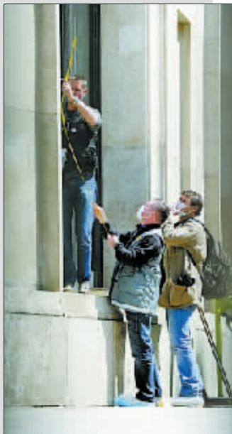
警察在巴黎现代艺术博物馆失窃现场调查。

在被认为安保应如铜墙铁壁的博物馆,为何失窃案连连?答案也许正如北京市文物局副局长刘超英所指:“目前博物馆最大的漏洞在于人员的意识和责任心。”而这已成为世界性的问题。