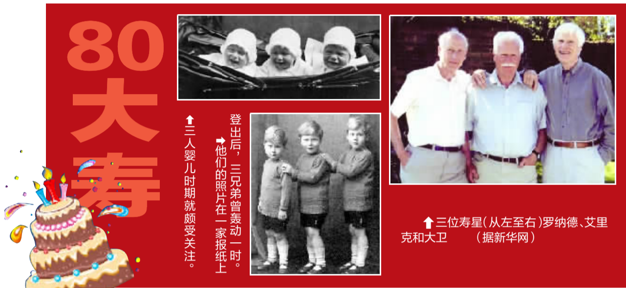
↑三人婴儿时期就颇受关注。 ↑他们的照片在一家报纸上登出后，三兄弟曾轰动一时。