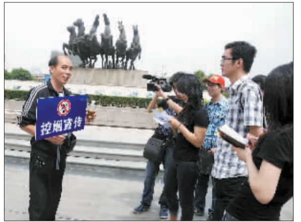
中央媒体记者采访我市义务控烟员。

与到公共场所禁烟中，走在了全国前列。”了解完相关情况，一名中央媒体记者表示，要实现公共场所禁烟，提高全民控烟意识很重要，而动员广大市民参与控烟活动能有效提高全民控烟意识。