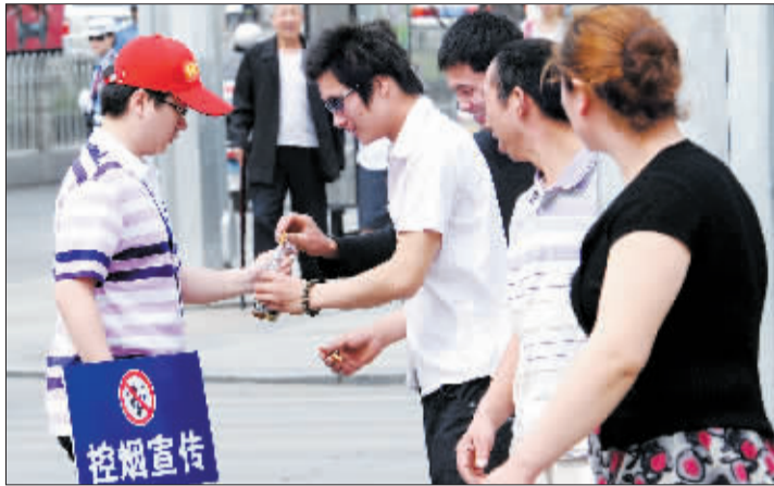
昨日，在义务控烟员的劝告下，抽烟者自觉将香烟投入水瓶。