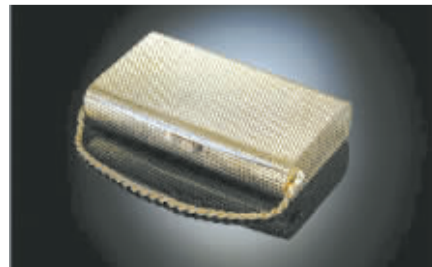
“故宫失窃案”中的古董手袋