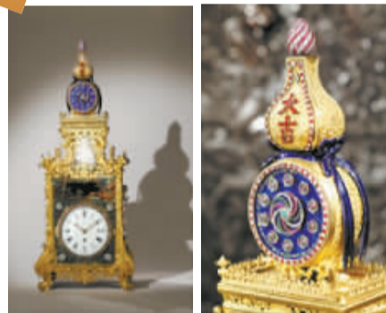
估价7000万元的清乾隆御制西洋风格座钟

据介绍,过去西方贵族女性热衷于社交活动,时刻保持靓丽的妆容至关重要,而当众补妆被认为是非常失礼的行为。于是,可以藏匿脂粉、口红的小巧化妆盒和手袋成了她们锦衣华服的最佳伴侣。时尚女性与珠宝工匠共同追求化妆盒的精致外观和复杂工艺,使得这一方小小的手中之物成为今天的珍贵藏品。