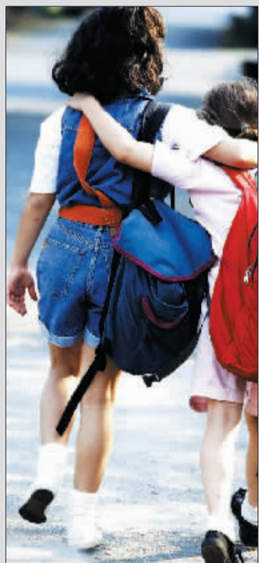
她们的童年快乐吗？