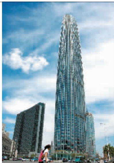
楼形似折纸 天津第一高

5月31日,天津津塔挂上天津环球金融中心的招牌。当日,天津市标志性建筑“津塔”挂上了天津环球金融中心的招牌。已建成的天津环球金融中心即“津塔”位于海河之畔,楼高336.9米,地上75层,地下4层,该写字楼借鉴了中国传统折纸艺术形式,是天津第一高楼。