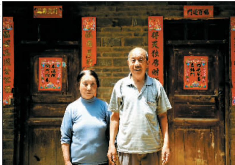
□记者 李砾瑾 / 文

一句话：“孩子，村里人都说你好的！” 清贫的一家人，勤劳的一家人。爷爷、奶奶想告诉孙女