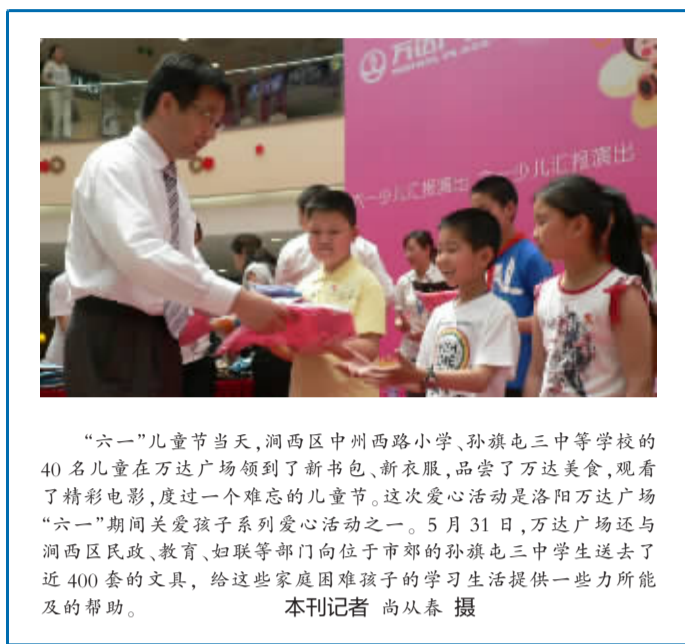
“六一”儿童节当天，涧西区中州西路小学、孙旗屯中等学校的40名儿童在万达广场领到了新书包、新衣服，品尝了万达美食，观看了精彩电影，度过一个难忘的儿童节。这次爱心活动是洛阳万达广场“六一”期间关爱孩子系列爱心活动之一。5月31日，万达广场还与涧西区民政、教育、妇联等部门向位于市郊的孙旗屯三中学生送去了近400套的文具，给这些家庭困难孩子的学习生活提供一些力所能及的帮助。