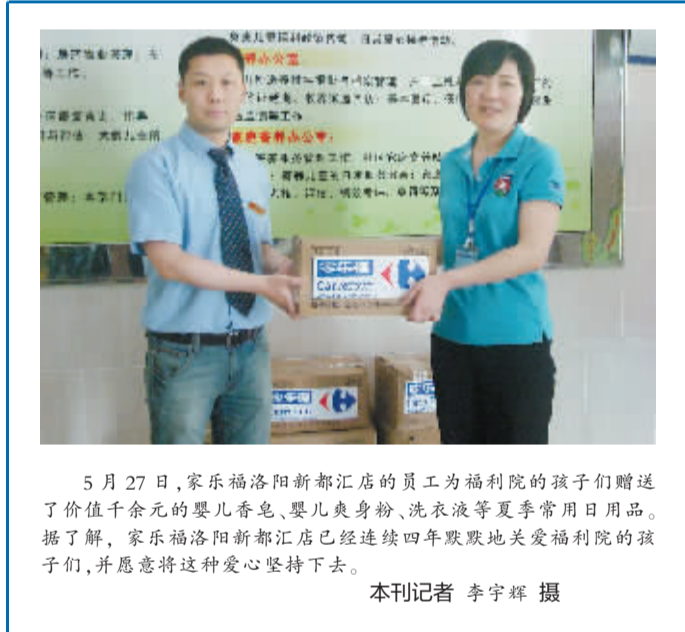
5月27日，家乐福洛阳新都汇店的员工为福利院的孩子们赠送了价值千余元的婴儿香皂、婴儿爽身粉、洗衣液等夏季常用日用品。据了解，家乐福洛阳新都汇店已经连续四年默默地关爱福利院的孩子们，并愿意将这种爱心坚持下去。