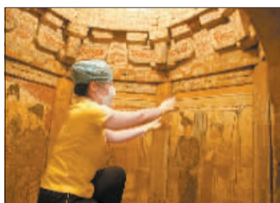
认真清理墓室壁画。

方案制订了,但在实际操作中还是会遇到许多突发情况。如何在墓葬内外加固支架,又对壁画和墓葬不造成损害,大家想了许多办法。最终他们决定在壁画上先铺宣纸,再铺海绵,最后再加上一层木板,为壁画本体留出