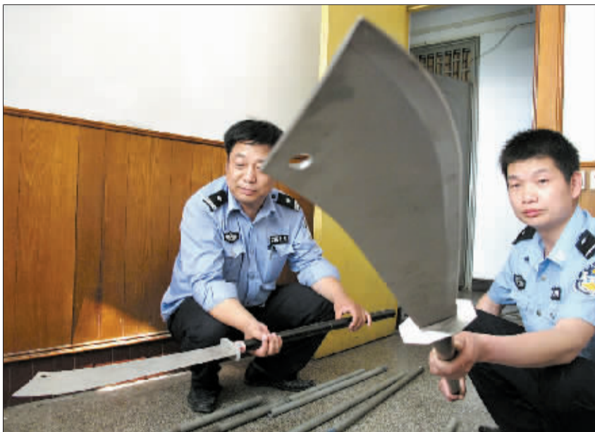
团伙成员使用的大砍刀

面对警方的严正警告，他们依然准备群殴，甚至挥刀砍向警察；对被怀疑的“告密者”，他们百般虐待……2日，市公安局召开“打黑除恶扫痞”专项行动新闻通气会，以温聚卫为首、盘踞伊川县的一个黑社会性质团伙的斑斑劣迹被曝光。