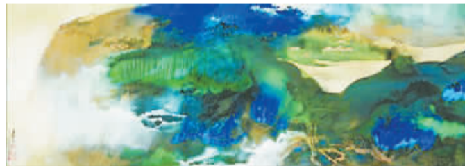
▲2010年5月，张大干所绘《爱痕湖》拍出1.008亿元，引领中国近现代书画跨越亿元大关。