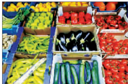
德国汉堡的一家蔬菜店。

中国日报供本报特稿 自5月初欧洲暴发肠出血性大肠杆菌(EHEC)疫情以来,已导致23人死亡,2400余感染者覆盖欧洲13个国家和北美,正当德国新感染者增长速度有所下降、疫情有缓解趋势之时,又爆出“基地”和塔利班等恐怖组织可能借机掀起生物恐怖主义袭击的消息。