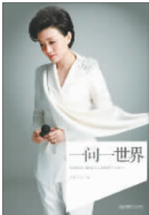
杨澜 朱冰 著