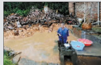
19日,浙江常山,一名村民站在自家被山洪冲毁的房屋前。