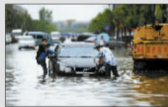
18日,湖北武汉,乘车人爬出在积水中熄火的轿车。