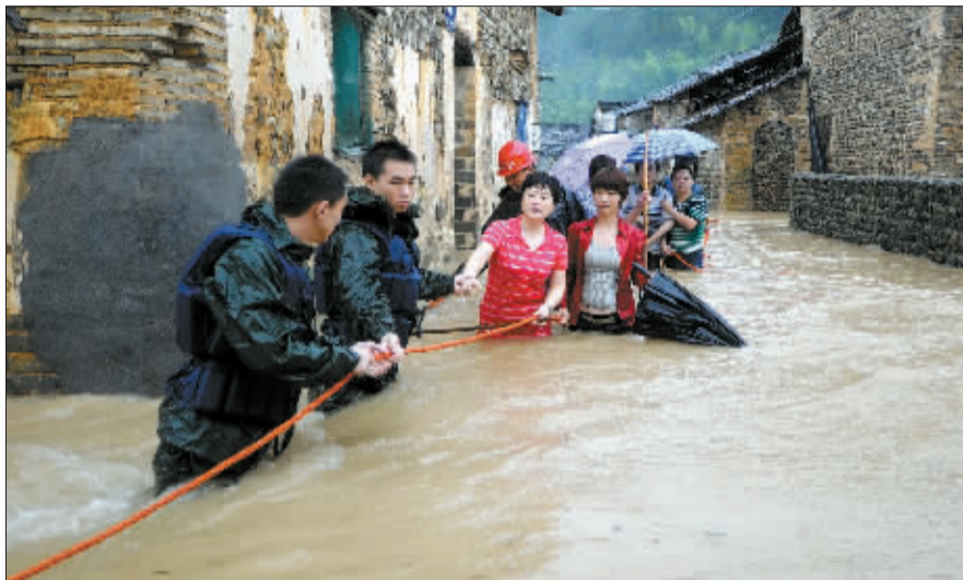
19日,武警官兵在江西省德兴市龙头山乡桂湖村用绳索解救被洪水围困的村民。

国家防汛抗旱总指挥部副总指挥、水利部部长陈雷19日介绍,近期主要降雨带仍维持在西南、长江中下游、江淮和浙闽等地区,太湖及杭嘉湖水网地区高水位仍将持续一段时间,同时,菲律宾以东洋面已有一个热带气旋活动,很可能发展为热带风暴,并可能向我国沿海靠近,全国防汛抗洪工作已进入关键时期和紧要阶段。