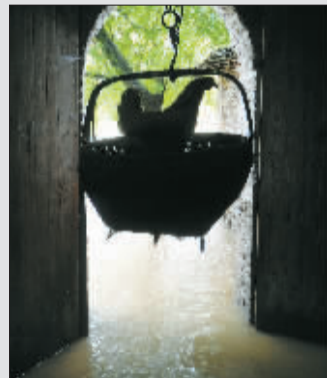
19日,在江西灾区,一只鸡呆在吊篮中躲避洪水。