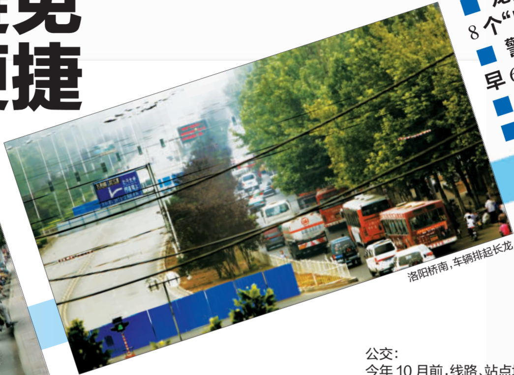
洛阳桥南,车辆排起长龙。