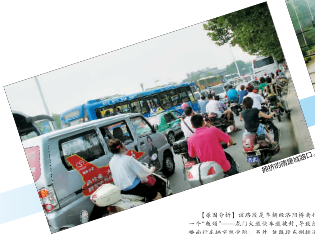
拥挤的隋唐城路口。

16日,龙门大道改造工程正式发轫。昨日,主车道被封闭的龙门大道迎来第一个周一早高峰。因龙门大道系我市南北主干道,是连接东部城区与新区、伊滨区的重要纽带,道路改造工程不可避免会为市民的出行带来种种不便。那么,我们该如何应对由此引发的问题?又有哪些办法可供我们选择?昨日,记者兵分多路,对相关情况进行一一打探,希望您未来几个月的出行提供参考。