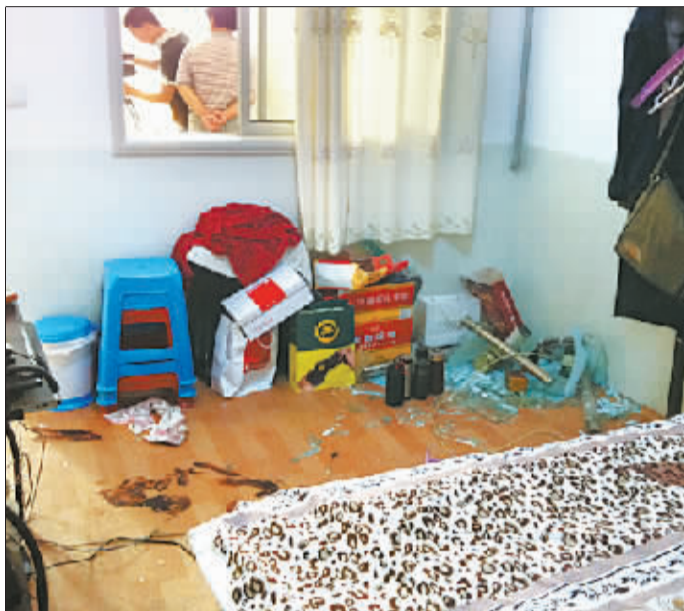
柳文家被破坏的卧室一角。