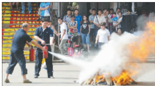
昨日上午,关林市场管委会组织开展了一场消防实战演练,市场专职消防员进行了灭火器和消防水枪灭火展示,并现场向观看演练的商户和市民讲解消防器材的使用方法和避险逃生技能。