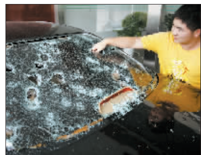
不少汽车的“命运”跟这辆车相似。

截至发稿时，灾害没有造成人员伤亡，嵩县县城已恢复供电，道路清理完毕，居民生活恢复正常。