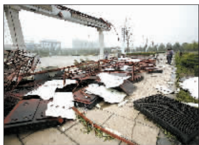
大型电子屏被狂风刮倒。

县城街道两边的景观灯多数被冰雹砸烂，沿街店铺门前有很多碎玻璃，那是被砸落的灯箱碎片。