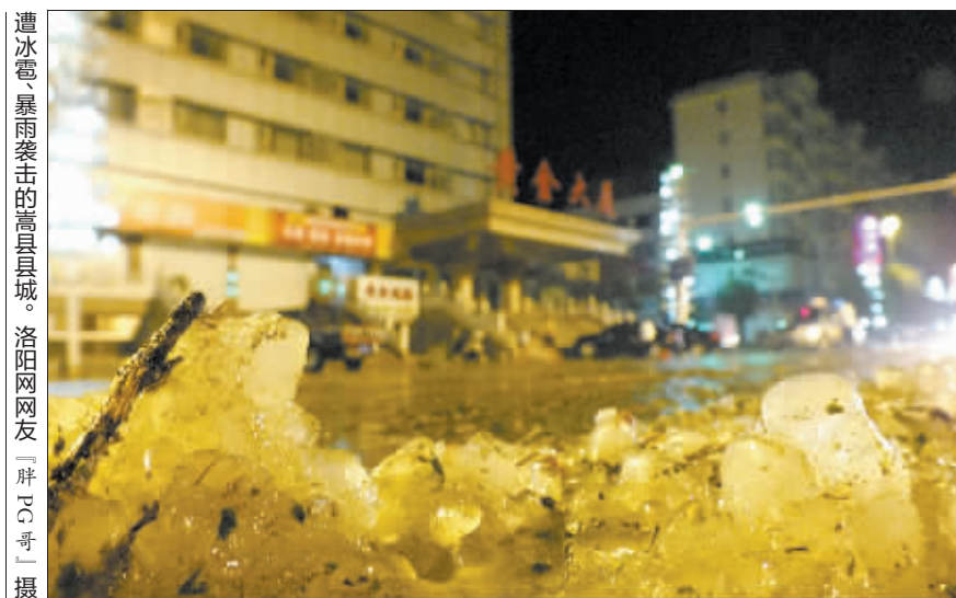
遭冰雹、暴雨袭击的嵩县县城。

24日22时许，嵩县发生强对流天气；在狂风、冰雹、暴雨的袭击下，不少房屋、树木、车辆被砸坏，一些群众还被大水围困