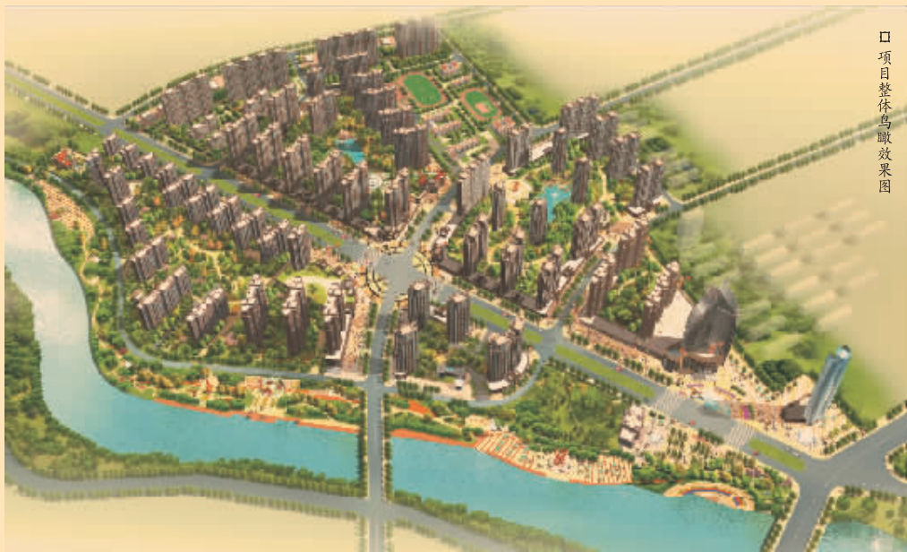
项目整体鸟瞰效果图

在社会各界的热切期盼下，“五女冢旧城改造安置房·天城一品项目奠基仪式”将于6月28日正式启动，这意味着2011年市中心最大的旧改项目将正式动工。