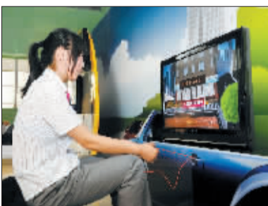
拉动绳索,就能了解地沟油如何变成柴油。