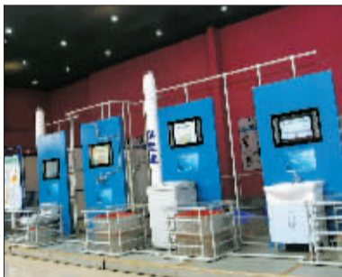
有关水的实验,会让您更加珍惜水资源。

另外,在大型人体内脏模拟器上,您可以看到正常肺脏、有吸烟史的肺脏、癌变肺脏的差别,还可以从不同的角度观察胃溃疡的形成过程。另外,多种有关健康知识的挑战游戏也在等您的参与。