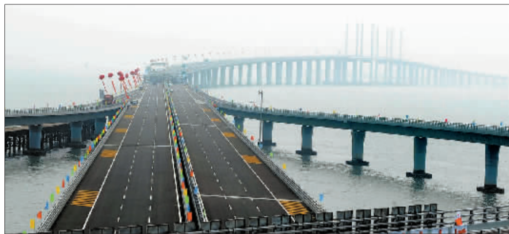
6月30日,通车仪式前拍摄的青岛胶州湾大桥红岛互通立交。当日,青岛胶州湾大桥正式通车,这是我国北方冰冻海域首座特大型桥梁集群工程,是国道主干线青岛至兰州高速公路的起点段,大桥全长36.48公里,是目前世界上已建成的最长的跨海大桥。大桥起于青岛市东部高科园,跨越胶州湾,在黄岛侧与已建成的济青南线顺接,使青岛、黄岛和红岛实现“品”字形连接。大桥为双向六车道高速公路兼城市快速路八车道,设计行车速度每小时80公里,桥梁宽度35米,设计基准期100年。

据悉,西气东输二线工程以宁夏中卫为界分为东、西两段,霍尔果斯—中卫段干线和中卫—靖边联络线为西段,已于2009年年底建成投产,中卫—广州段线为东段。截至今年5月28日,“西二线”已累计接输中亚天然气超过100亿立方米,与国内其他天然气管道相连的投产段已惠及我国18个省区市,超过1亿人受益。