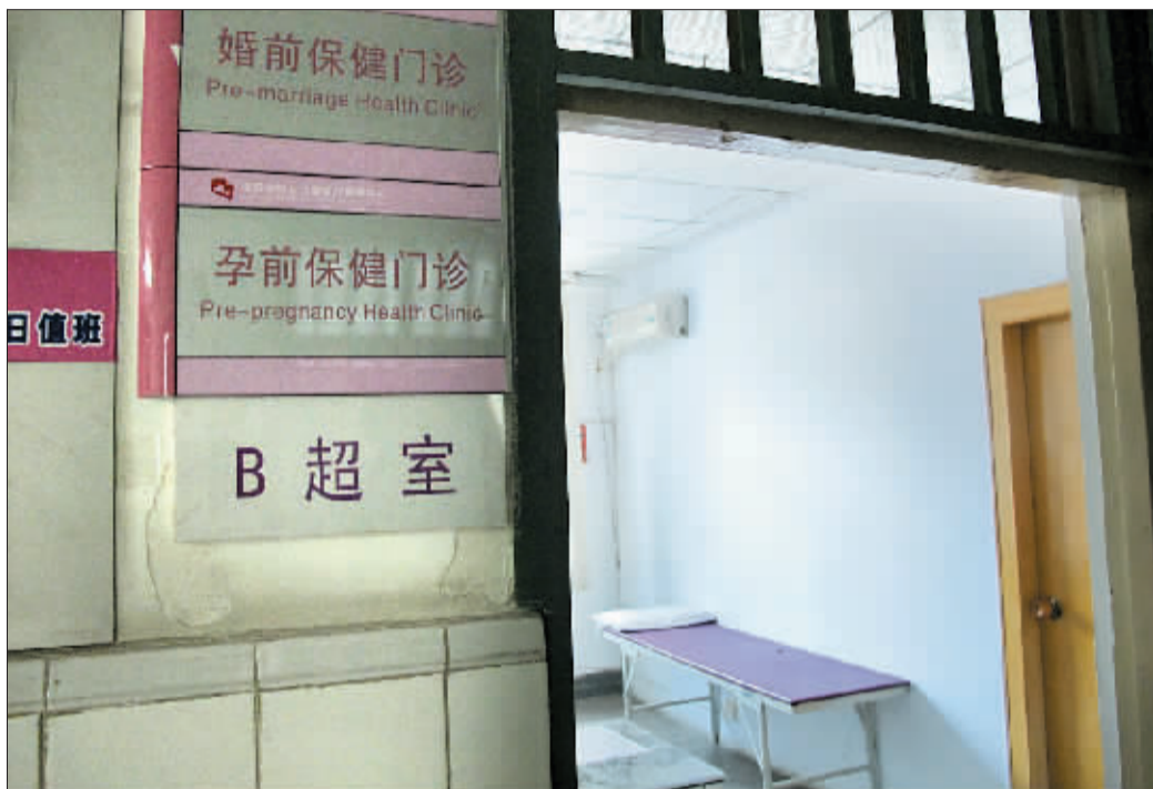
昨日上午，市妇女儿童医疗保健中心5楼的免费婚检科室有些冷清。