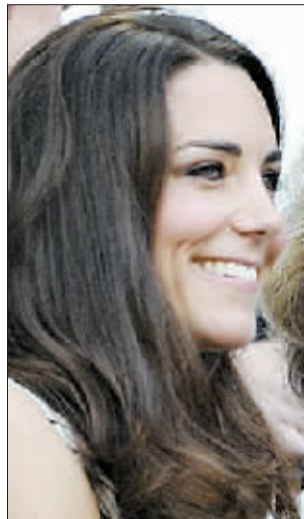
凯特·米德尔顿的“艺术鼻”