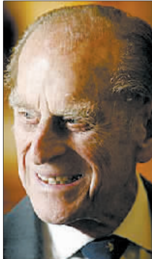
菲利普亲王的“肥大鼻”