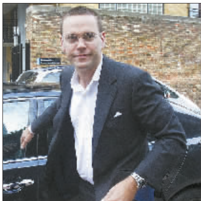
默多克之子詹姆斯也随父抵英。(据新华网)

中国日报供本报特稿 针对使用非法手段获取包括英国前首相布朗在内等多位名人政要私人信息的报道，英国《星期日泰晤士报》和《太阳报》7月12日出面予以否认，称其报道全部来自合法消息源。目前，英国朝野已对日前默多克新闻集团旗下《世界新闻报》窃听事件达成共识，要求默多克和其子以及《世界新闻报》前主编出席听证会接受质询。面对重重危机，有报道称新闻集团高层正考虑是否有必要出售旗舰子公司——英国国际新闻公司，以规避风险，获得更大利润。