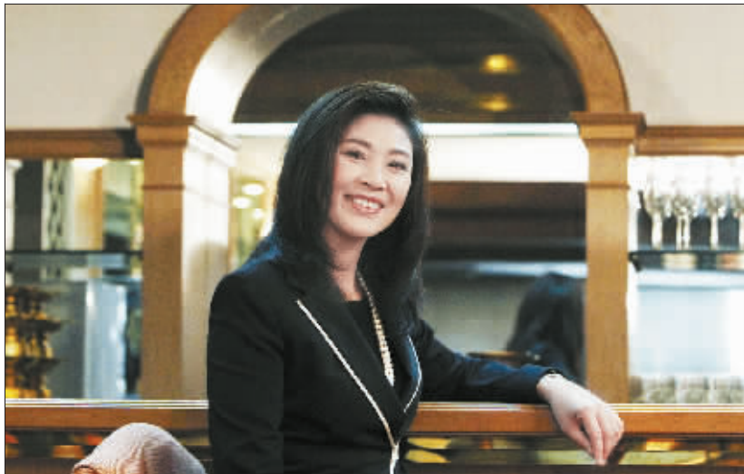
泰国“候任总理”英拉。

根据泰国2011年版宪法修正案，泰国国会下议院任期4年，由500名议员组成。泰全国分为375个选区，每个选区拥有1个国会下议院议席，由选民直接投票产生，即选区制议员；其余125个议席按照政党所获直接投票议席数比例分配，即比例代表制议员。选举结果公布后的30天内，新国会下议院必须投票选举议长，60天内投票选举总理。