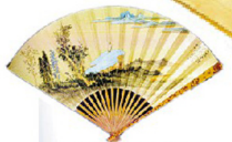
在今年嘉德春拍会上，以195.5万元成交的张大千《春江远眺》成扇。