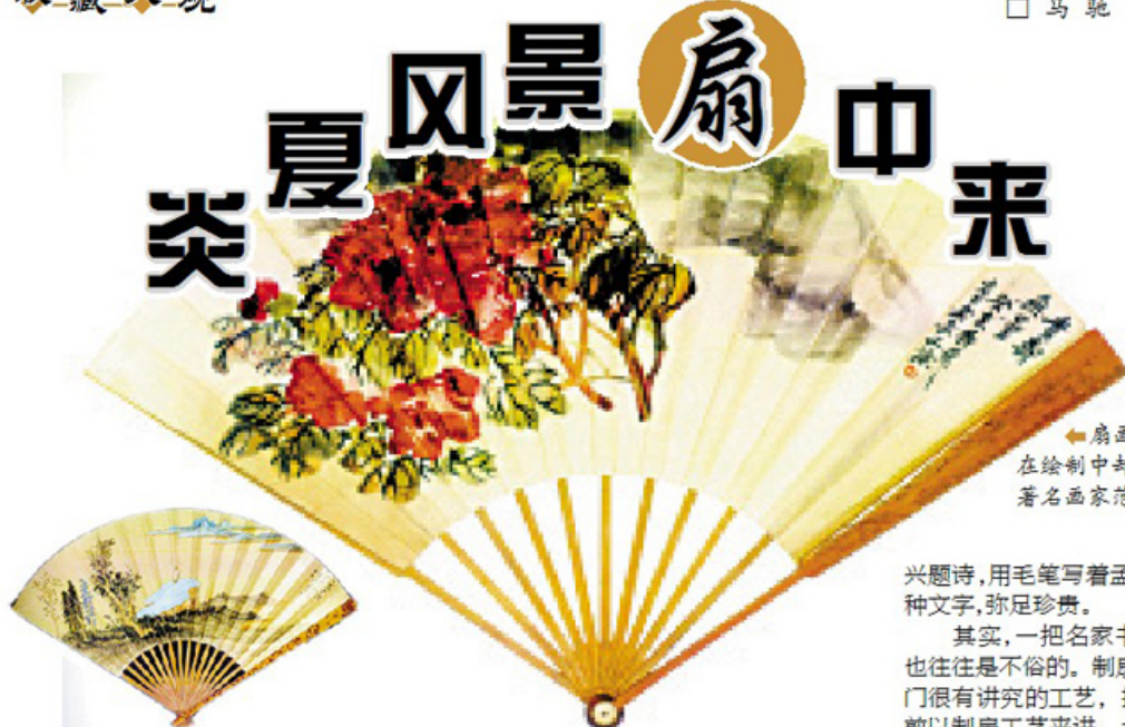
扇画虽然尺幅不大，在绘制中却很见功力。图为著名画家范权的作品。